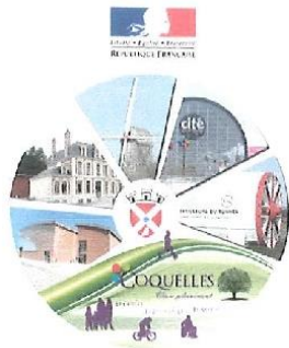
Ville du Tunnel sous la Manche